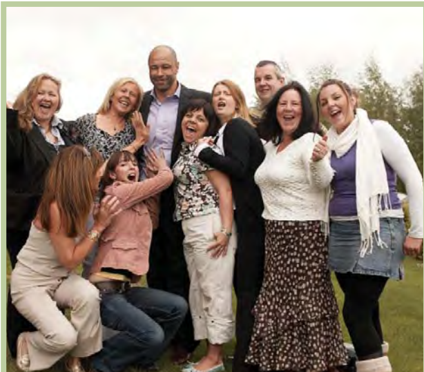
Seo an t-iarphleadóir idirnáisiúnta, Paul McGrath, agus é in éineacht le mic léinn atá ag gabháil do chéad bhliain na céime BA i Staidéar Andúile. Seoladh an chéim go hoifigiúil in ITBÁL ar 9 Bealtaine, 2007, agus seo an chéaduair atá a leithéid de chúrsa á theagasc in Éirinn.