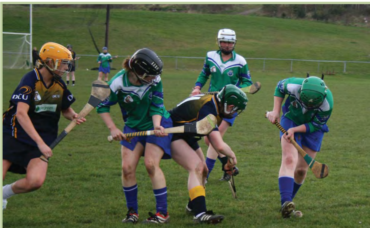
Seaimpíní Chorn Phuirséil, ITBÁL, agus iad ag imirt in aghaidh OCBÁC i gCluiche Ceannais na Léige Camógaíochta.

D'éirigh go breá leis an bhfoireann chispheile mheasctha in ilchomórtas na gcoláistí sa Ghaillimh. Bhuadar an Shield. Chuaigh foireann na bhfear agus foireann na mban sa chomórtas, leis, sna comórtais idir-ollscoile agus chruthaíodar go seoigh ar fad.